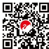
惠威专业音响-说明书