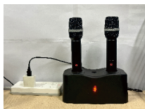
话筒使用充电座充电中 (开/关机键亮红色)

方式2: 逆时针旋开话筒管,取出充电电池,请使用18650电池专用充电器给电池充电,约2小时左右可充满(用户需自行购买18650电池专用充电器);长期不使用本话筒时请取出内置电池。