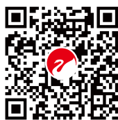
惠威专业音响-订阅号