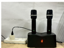
话筒充满电 (开/关机键亮绿色)