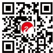
惠威专业音响-网站